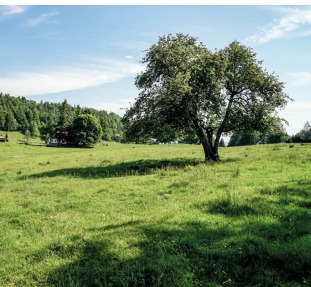
Auf der Hochebene Montagne de Moutier.

Café-Restaurant Le Soleil de Châtillon, Tel. 032 422 44 77, www.le-soleil-de-chatillon.ch