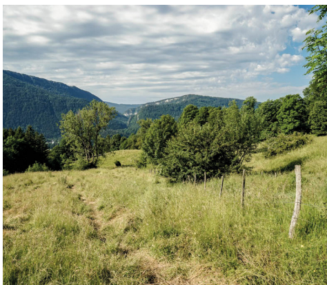
Oberhalb von Moutier. Im Hintergrund die Gorges de Court.