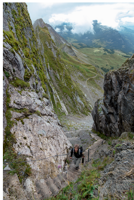
Blick vom Grat auf die Treppe im Lättgässli.