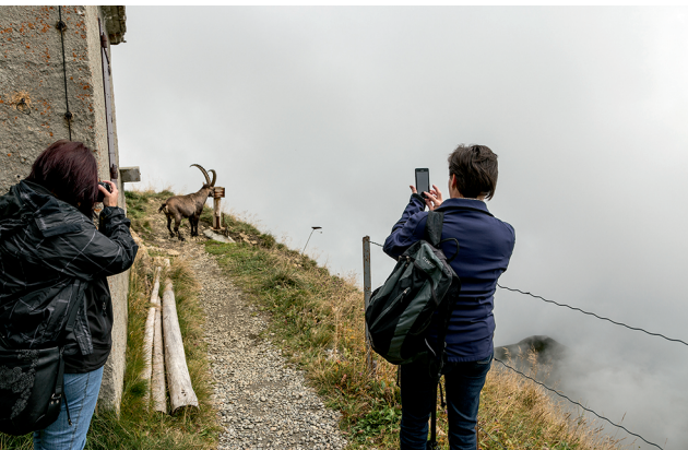
Ein Steinbock bedient sich beim Restaurant Rothorn Kulm am Salzgeleck.

Bergbahnen Sörenberg, 041 488 21 21 Erlebnis-Restaurant Rossweid, 041 488 14 70 Gipfel-Restaurant Rothorn, 033 951 26 27 www.soerenberg.ch