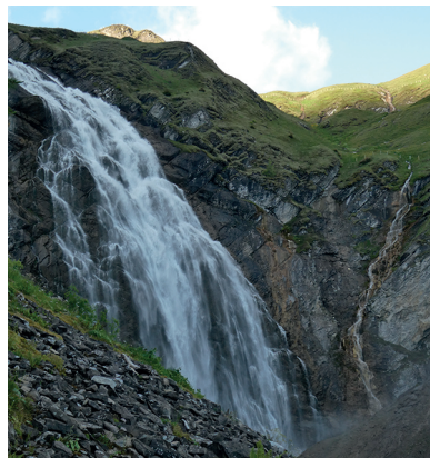
Höhepunkt der Wanderung sind die Entschliffefälle.