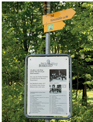
Ein Themenweg ist dem Leben und Werk des Komponisten gewidmet.