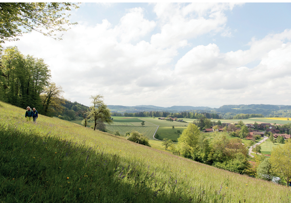
Über Wiesen und Weiden nach Oberlangenhard, wo der Komponist Paul Burkhard lebte.