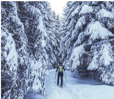
Ein Wintermärchen.