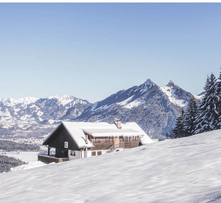
Das Chalet La Grosse-Oubèca vor dem Dent de Broc und dem Dent du Chamois.

Erreichbar ist die Buvette mit dem Alpentaxi ab dem Bahnhof Bulle. Taxi Etoile, Tel. +41 26 912 05 12, www.taxialpin.ch Buvette des Amis de la Chia, samstags und sonntags geöffnet, 026 912 73 75, www.la-gruyere.ch Hütte des Skiclubs Alpina, sonntags geöffnet,