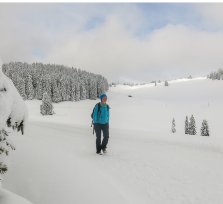
Nicht allzu lange, aber beglückende Winterwanderung auf dem Jaunpass.

Camping Jaunpass, 033 773 69 53, www.campingjaunpass.ch Hotel Des Alpes, 033 773 60 42, www.desalpes-jaunpass.ch Taverne Jaunpass (vermietet auch Zimmer), 033 773 63 54, www.taverne-jaunpass.ch