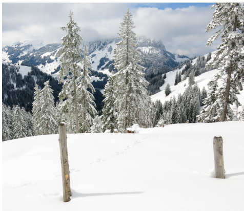
Die Äste biegen sich unter dem Druck des Schnees fast bis an den Boden.