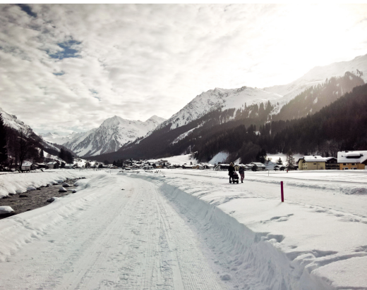
Entlang der jungen Landquart führen Loipen und Winterwanderweg taleinwärts nach Äuja.

Infobüro Klosters, 081 410 20 20, www.klosters.ch Restaurant Alp Garfiun, Klosters, 081 422 13 69, www.alpgarfiun.ch