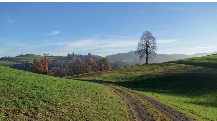
Die abgerundeten Hügel machen den Charakter dieser Region um den Hegewald aus.

Gasthof zu den Alpen, Eriswil, 062 966 18 47, http://gasthof-alpen.ch/