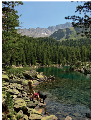
Am Ufer des Lagh da Saseo.