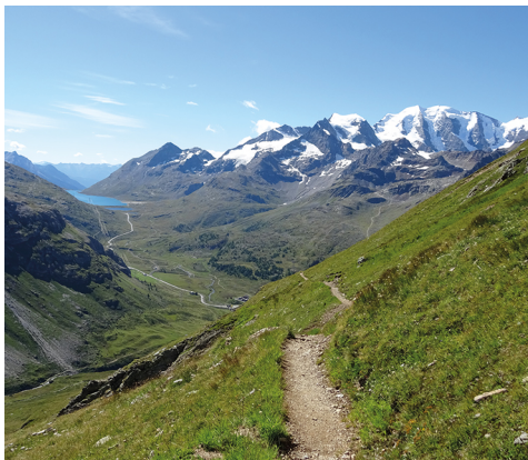
Aussicht zum mehrgipfligen Piz Palü, zum Piz Cambrena links davon und zum Lago Bianco auf der Berninapasshöhe.