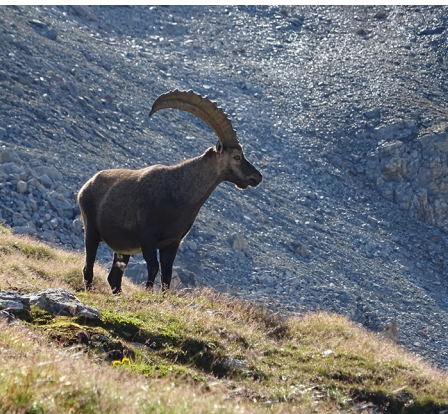
Auf dieser Wanderung stehen die Chancen gut, Steinböcke beobachten zu können.

Rückreise mit Zug oder Bus vom Bahnhof Bernina Diavolezza.