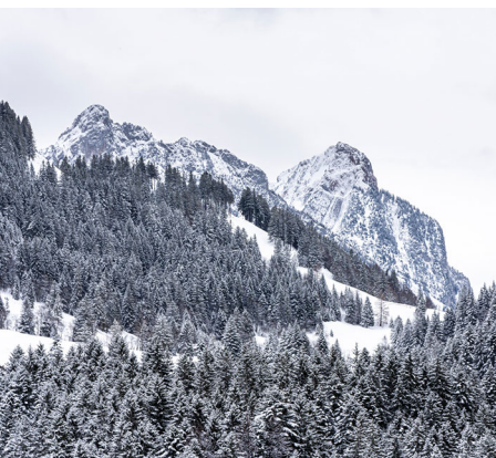
Derrière d'épaisses forêts trônent les Mythen.

On accède à Sattel, station inférieure du Hochstückerli, en train depuis Biberbrugg ou en bus depuis Schwyz.