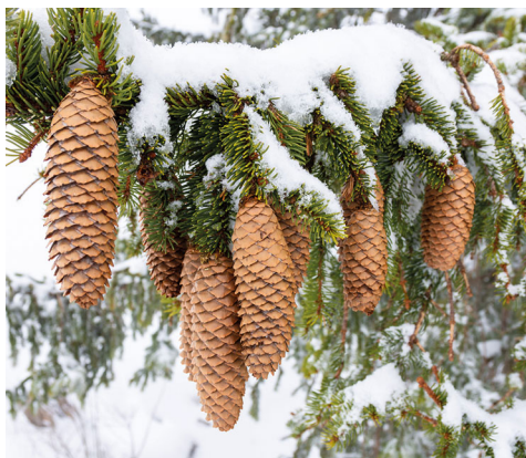
Une branche de sapin bien chargée.