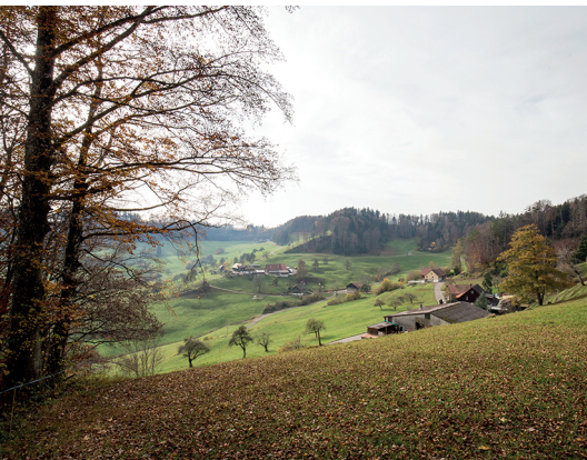
Agréable succession de montées et de descentes entre Niederwies et le Chabishaupt.

Restaurant Schauenberg (Huggenberg), 052 364 35 34, www.restaurant-schauenberg.ch Auberge Guhwilmühle (Sennhof), 052 364 21 63, www.guhwilmuehle.ch Nombreuses possibilités de restauration à Dussnang et Elgg.