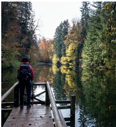
Peu avant Elgg, le chemin traverse le Farenbachtobel sur des ponts.