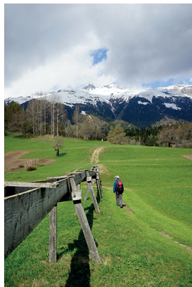
L'eau a toujours été précieuse à Goms. Aqüeduc restauré à Ernen.