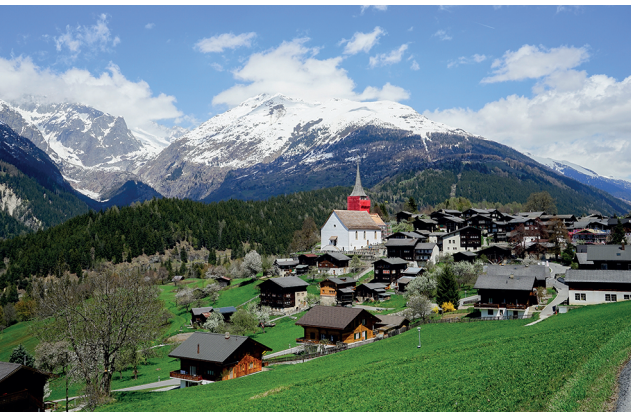
Le prix Wakker a été décerné au village d'Ernen pour son entretien du centre historique.

Restaurant Gommerstuba, Niederernen, 027 971 29 71, www.gommerstuba.com