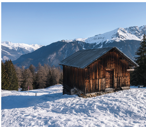
L'itinéraire permet de découvrir des mayens typiques de la région.