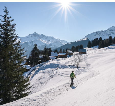
Sur le tronçon plat menant à Tigias Davains.

On accède à Parsonz en car postal depuis Tiefencastel ou Savognin en passant par Cunter et Riom. Trajet du retour depuis Parsonz: tous les jours jusqu'aux environs 19 h 00.