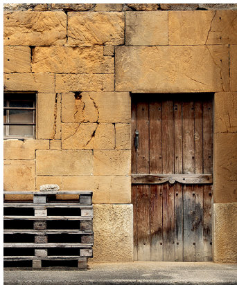
Dans les villages vigneronniers, les murs des habitations sont en pierre d'Hauterive.