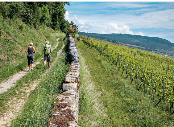
Entre Cornaux et Cressier, le chemin longe les vignes.

Laténium, parc et musée d'archéologie, Hauterive, 032 889 69 17, www.latenium.ch Hotel Garni «Villa Carmen», La Neuveville, 032 751 23 69, www.villacarmen.ch