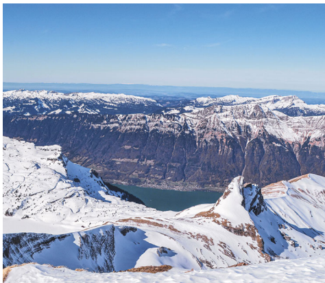
Depuis le sommet du Faulhorn, vue sur le lac de Brienz en contrebas et le Niederhorn, la crête Brienzergrat et le Hohgant en direction du Jura.