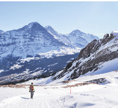
Splendide vue sur l'Eiger, le Mönch et la Jungfrau.

Des luges peuvent être louées à Grindelwald ou à