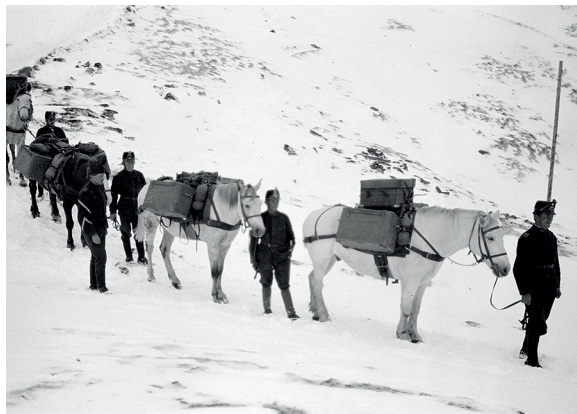
Colonne suisse de mulets dans la descente du Piz da las Trais Linguas.