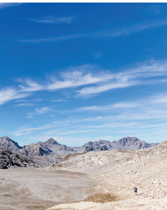
Descente rocailleuse du Piz Umbrail.

Berghaus Astras, col de l'Umbrail, 079 513 39 16 Plusieurs restaurants et hôtels à Valchava et à Santa Maria, www.val-müstair.ch Association et musée Stelvio-Umbrail 14/18 à Santa Maria, www.stelvio-umbrail.ch