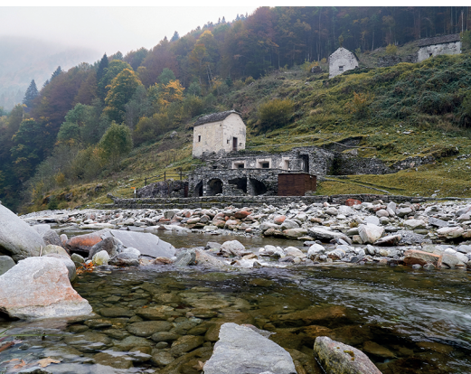
L'Isorno entre en Suisse au niveau des Bagni di Craveggia.

Bar Onsernonese à Spruga, 091 797 17 83 Palazzo Gamboni à Comologno, 091 780 60 09, www.palazzogamboni.ch Osteria Al Palzign à Comologno, 091 797 20 68 Capanna Alpe Saléi, 091 797 20 32, www.alpesalei.ch