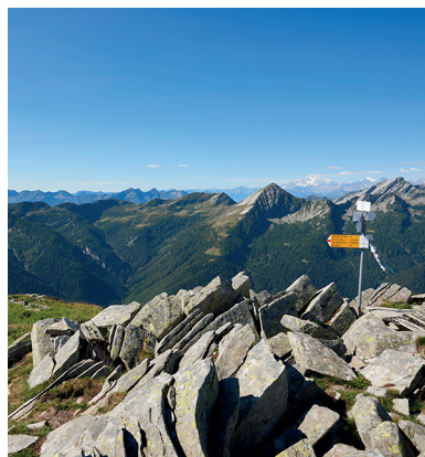
Wilde Natur und Einsamkeit: Auf dem Gipfel des Pilone sieht man auf die Täler des Tessins.