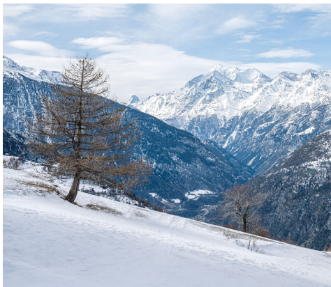
Le circuit se termine par une vue sur les sommets enneigés.