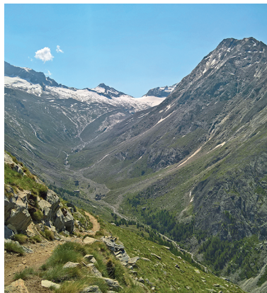
Coup d'œil en arrière en direction d'Almagelleralp.