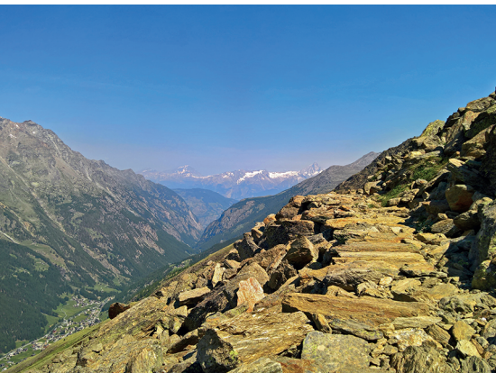
Au loin, le sommet du Bietschhorn.

On accède à Saas Almagell et Saas Grund en car postal depuis Viège. De Kreuzboden, c'est en téléphérique qu'on gagne Saas Grund.