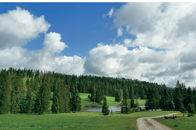
Le site de Plain de Saigne est un lieu parfait pour une halte.

Café & Restaurant Auberge de la Gare, Le Pré-Petitjean, 032 955 13 18, www.aubergedelagare.ch Restaurant Buffet de la gare, La Combe, 032 484 94 51