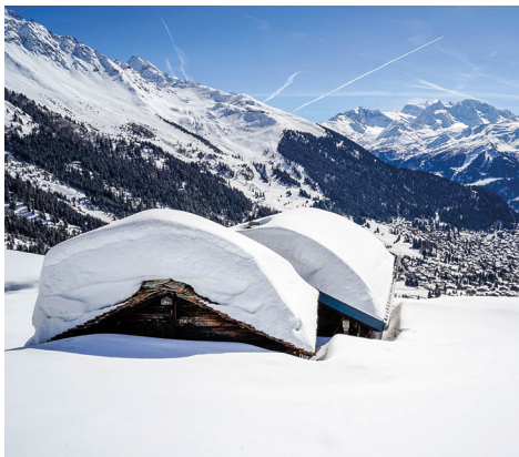
Des cabanes enneigées au-dessus de Verbier.