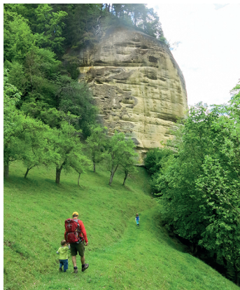
De majestueuses falaises de molasse bordent le chemin.