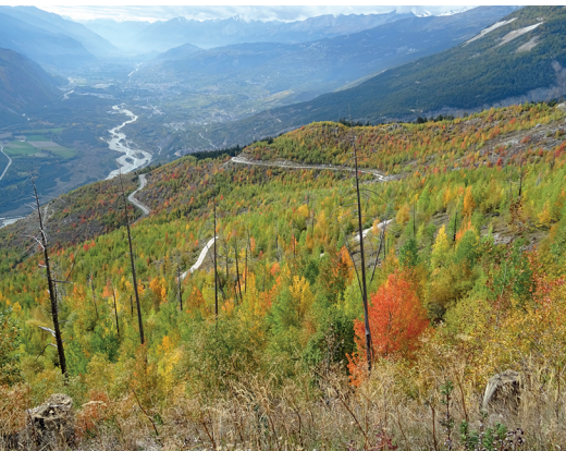
Même 20 ans plus tard, les troncs des arbres brûlés dépassent encore les jeunes arbres.

Hotel-Restaurant Rhoneblick, Guttet, 078 769 75 25, www.rhoneblick-wallis.ch