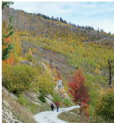
En marchant dans la région incendiée, on constate l'étendue de la surface touchée.