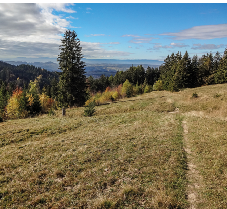
L'itinéraire s'apprête à plonger sur Semsales, dans la plaine.

Il n'y a pas possibilité de ravitaillement sur le parcours de la randonnée.