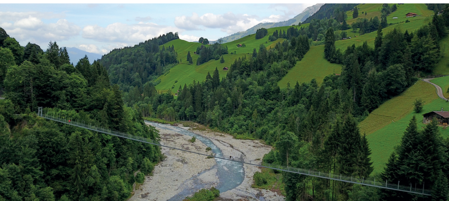
Le pont suspendu Hostalde surplombe le large lit de la rivière Entschlige.

Buvette «Hängebruggbeizli», Hostalde, 033 671 15 83