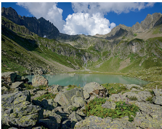
Le petit lac sur l'alpage de Seewen invite à la détente.