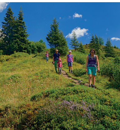
Les sapins deviennent rares à partir de Sellflue.

Cabane Sewen, 041 885 18 72, www.sewenhuette.ch