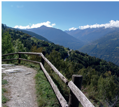
Vue magnifique sur le val d'Hérens et le val des Dix.