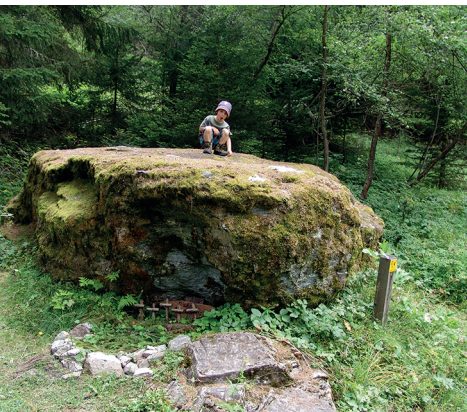
La Pierre des Enfants et son cimetière miniature.

Hôtel-restaurant du Mont-Noble: 027 203 11 33, www.montnoble.ch