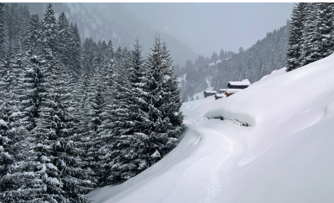
Dans la vallée du torrent Flem, en contrebas de l'Alp da Stiars.

Bergbahnen Brigels, 081 920 14 24, www.brigels-bergbahnen.ch