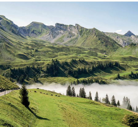
À gauche, le Risetenstock, à droite, le Brisen.

Restaurant de montagne Tannibüel, tél. 041 620 12 18, www.tannibuel.ch