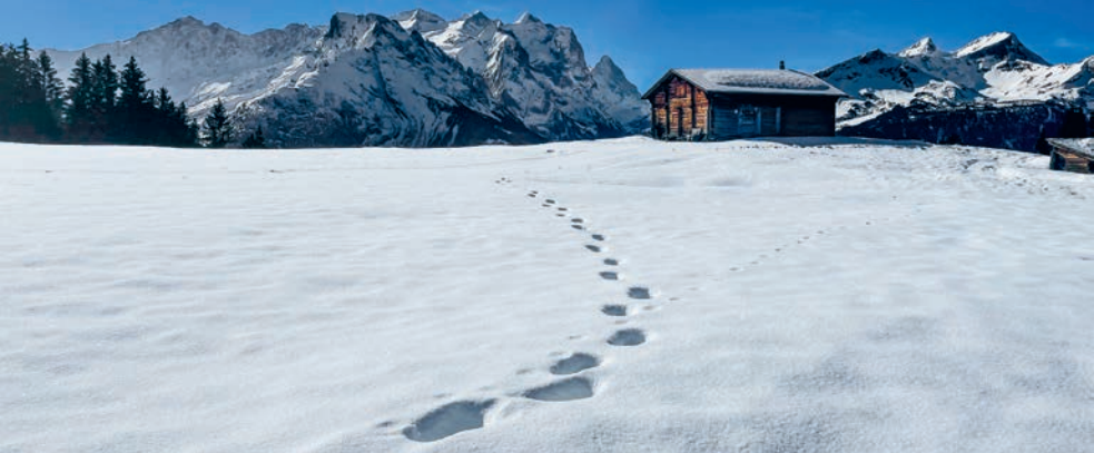
Vue sur les Engelhörner peu après Undere Stafel.