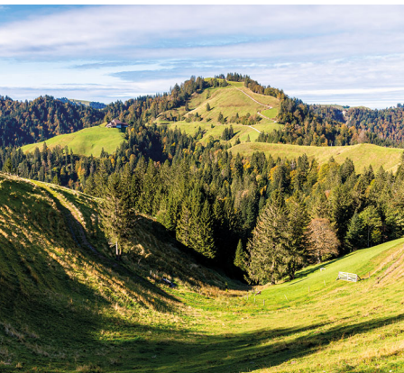
Alors que les sapins restent verts, les feuillus se préparent pour l'hiver.

Gasthaus Hirschen in Luthern Bad, 041 978 13 57, www.hirschen-luthernbad.ch Berghotel Napf, 034 495 54 08, www.hotelnapf.ch