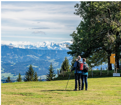
Qui connaît tous les sommets?