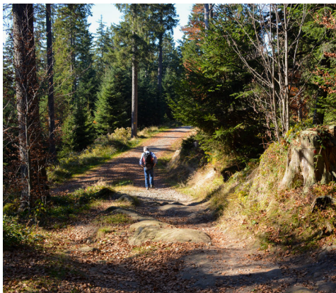
Le chemin panoramique de la vallée d'Ägeri offre peu de points de vue, mais une jolie piste par le Muetegg.