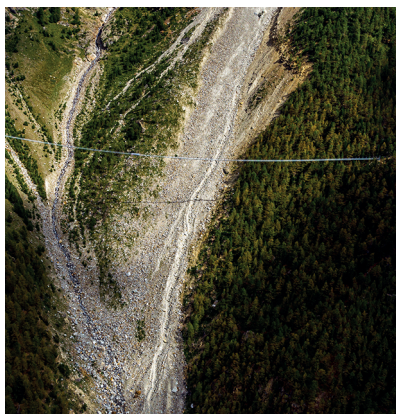
En dessous, la montagne s'agite. Aujourd'hui, le nouveau pont est bien mieux protégé.