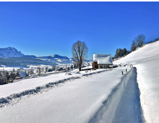
Sur le chemin entre Rietli et Gais. A gauche, l'Alpstein.