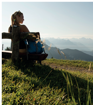
Plusieurs bancs et restaurants rendent la randonnée agréable.