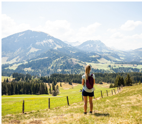
Par beau temps, la vue est magnifique.