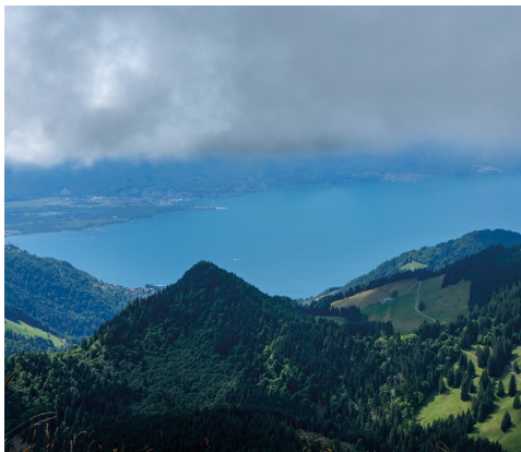
En haut du col, une toute nouvelle vue se dégage: le lac Léman.