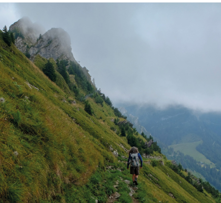
Le long du flanc est escarpé du Cap au Moine, nous nous dirigeons maintenant vers le Col de Jaman.

On accède à Montbovon en train depuis Bulle (FR) ou Zweisimmen (BE).