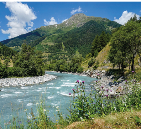
Au bord de l'Inn, peu après Susch.

On accède à Lavin et Zernez en train depuis Landquart. À Lavin, Susch et Zernez, il y a des hôtels, des restaurants et des commerces.