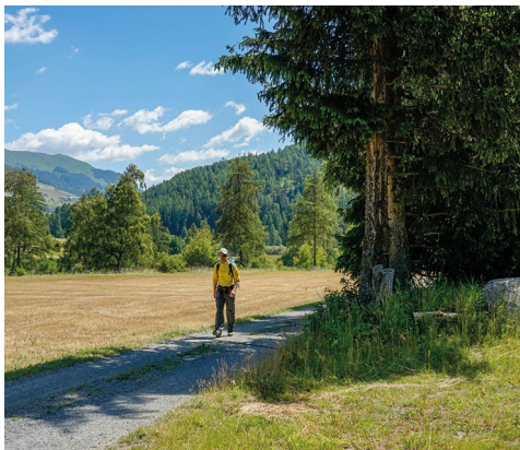
Le chemin dans la vallée est très agréable.