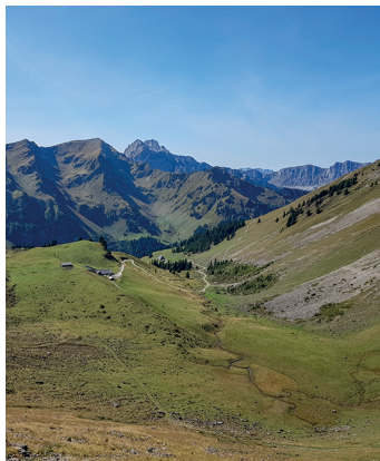
Pendant la descente vers la vallée du Diemtigtal.