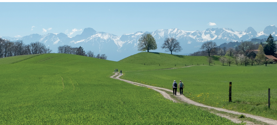
Peu avant le hameau de Hofmatt: des prairies verdoyantes et les sommets enneigés au loin.

Boulangerie-Café Zät Sibe, Kehrsatz, 031 961 19 46 Restaurant Änglischbärg, Wohnheim Kühlewil, https://kuehlewil.ch/ Restaurant Linde, Kaufdorf, 031 802 04 64, www.lindekaufdorf.ch/