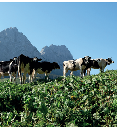
Vaches fribourgeoises devant les Gastlosen.

Plusieurs restaurants et hôtels à Jaun et à Charmey.