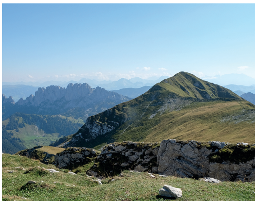
Le Cheval Blanc, l'un des deux sommets de la Hochmatt.