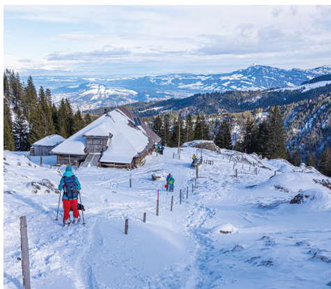
L'alpe Gumm.