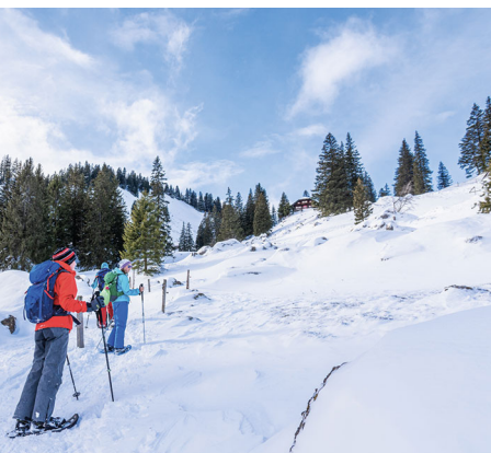
Brève réflexion: peut-on couper par la poudreuse?