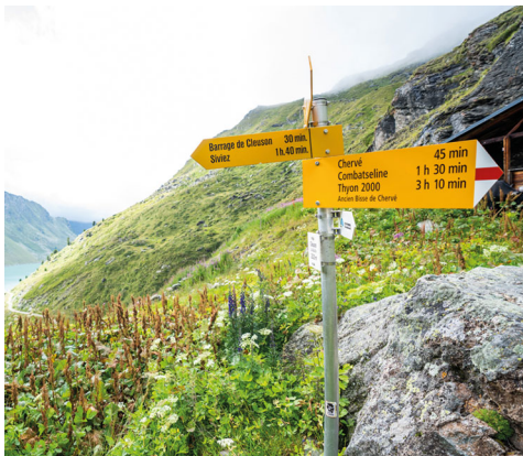
On dispose d'assez de temps pour profiter de la vue.