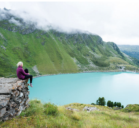
Peu avant la descente, on jette encore un regard sur les eaux scintillantes du lac de Cleuson.

On accède à Siviez en bus depuis Nendaz. Le télésiège de Combatzeline ne fonctionne que par beau temps. À Siviez et à Combatzeline se trouvent plusieurs possibilités de restauration. En chemin, il n'y en a aucune.