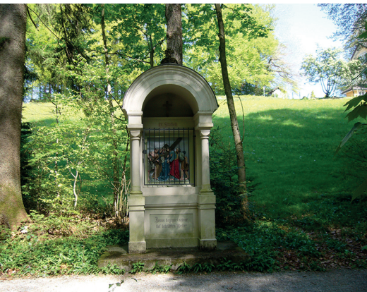
Calvaire sur le chemin de croix proche du site de Maria Bildstein.

Musée de la pâtisserie, confiserie et boulangerie, Reckplatzstr. 21, 8717 Benken, tél. 055 293 50 93, www.baekereimuseum.ch .