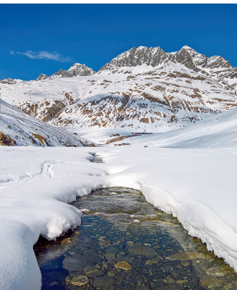
Le ruisseau de Bergalga dans ses habits d'hiver.

Berghotel Turtschi, tél. 081 650 88 00, www.berghotel-turtschi.ch