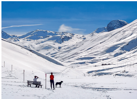
Le col de Bergalga et l'imposant Wissberg (à dr.) ferment la vallée vers le sud.