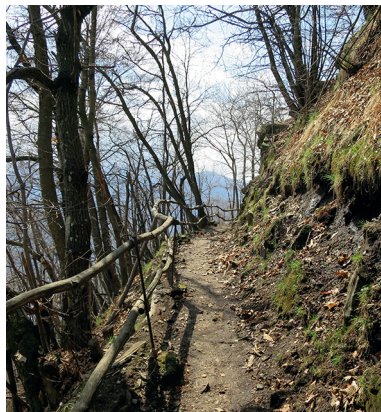
Un chemin panoramique bien sécurisé mène à San Bernardo.