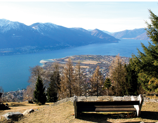
La vue entièrement dégagée s'étend de Cordonico au lac Majeur.

Funicolare Locarno–Madonna del Sasso, 091 751 11 23