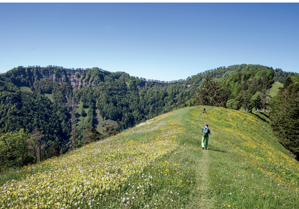
Cette randonnée offre de belles vues, comme ici sur le Laubberg, en direction du Schnebelhorn.

Nombreuses possibilités de restauration à Wald.