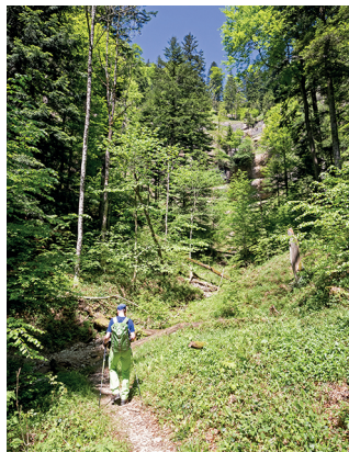
Par la forêt depuis le Dägelschberg pour rejoindre Tössscheidli.