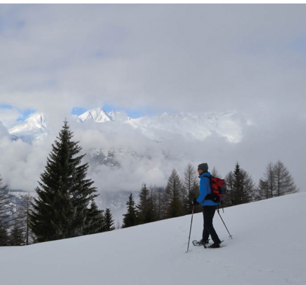
Le soleil commence à percer.

On accède à Rosswald en bus depuis la gare de Brigue. Descendre à l'arrêt «Ried-Brig, Talstation LRR».