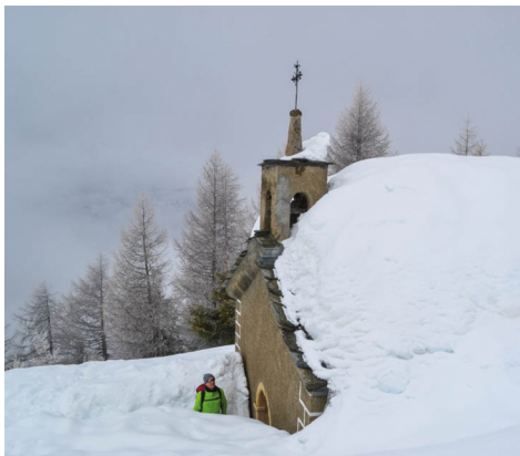
De la neige à hauteur d'homme près d'une petite chapelle.