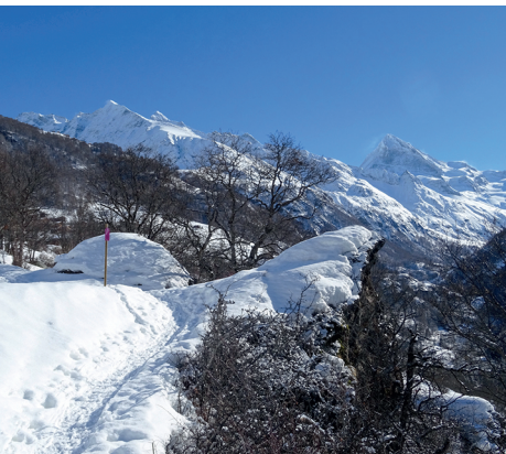
Dans la montée vers La Forclaz.

En cas de danger d'avalanche, la partie supérieure de la piste est fermée. Informations auprès de l'Office du Tourisme d'Evolène Région, 027 283 40 00.