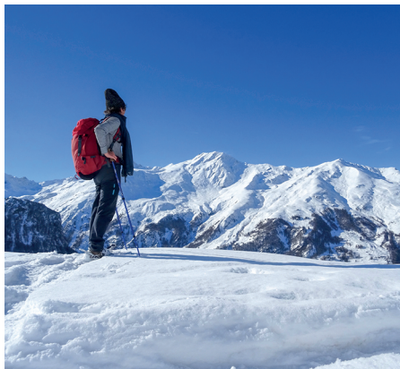
Vue sur le Mont de l'Etoile et La Palantse de la Cretta.